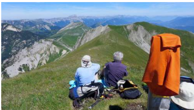
Sommet du Jocou