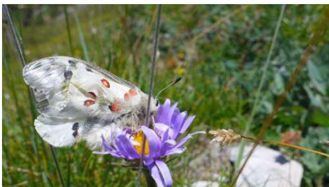
Apollon sur Aster des Alpes