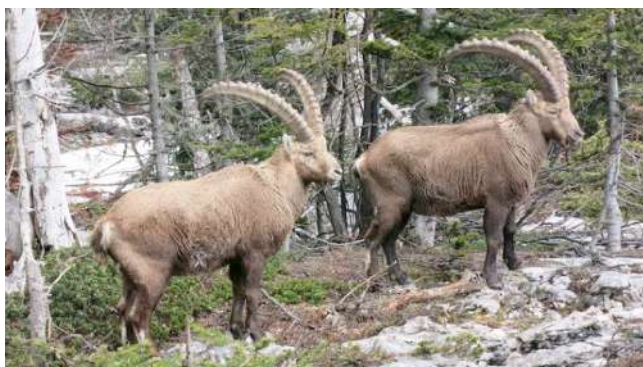
Bouquetins du Vercors