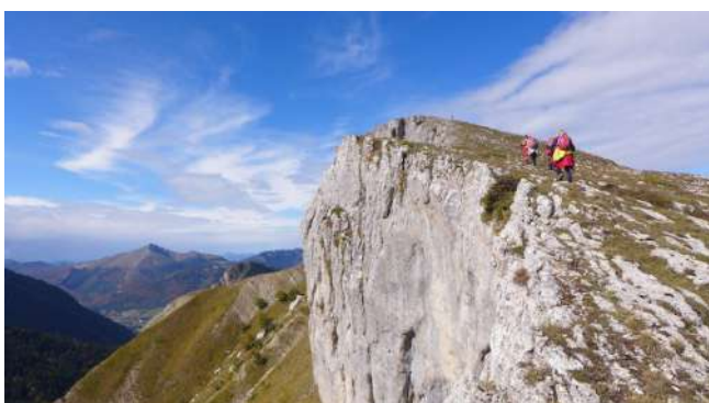
Vers la pointe Feuillette