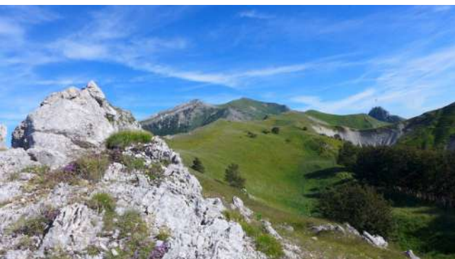
Rocher de La Glaisettes