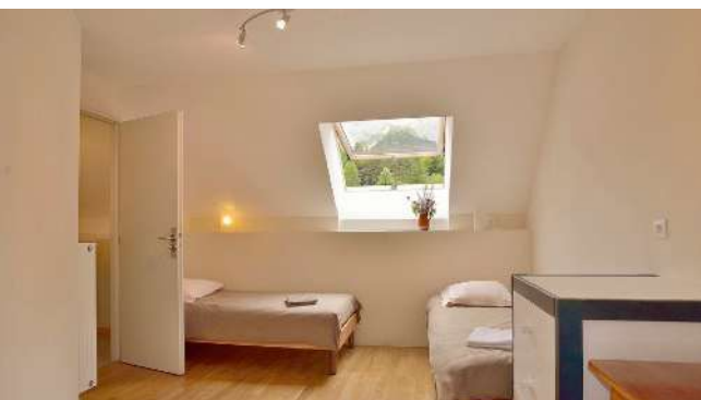
Une chambre avec salle de bain privative