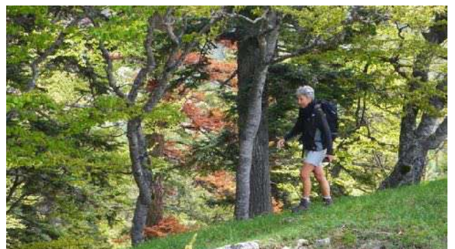
Belle randonnée forestière