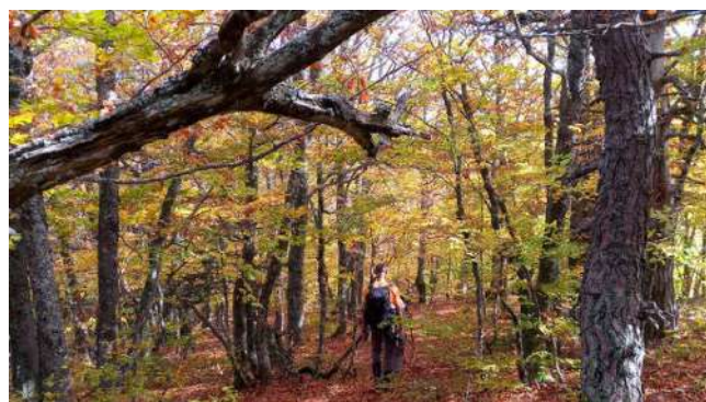
Petite marche avant le Dao Yin