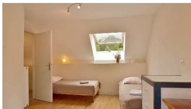
Une chambre avec salle de bain privative