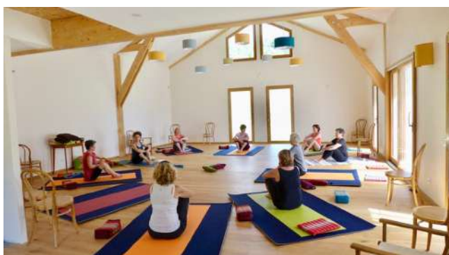
Une lumineuse salle ouverte sur les montagnes