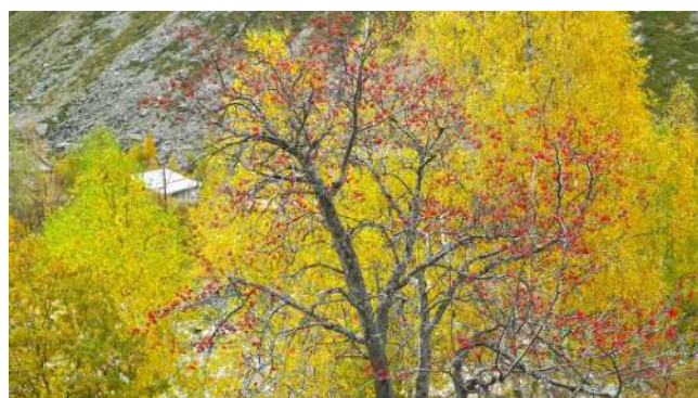
Arbres aux couleurs de l'automne