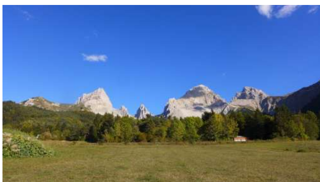
Les Aiguilles de Lus la Croix-Haute devant le centre