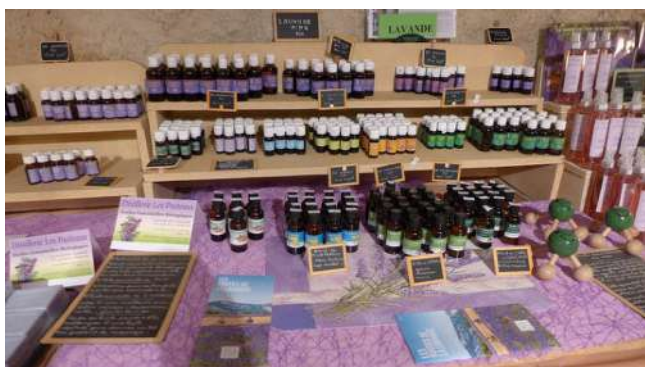
Huiles essentielles du Buëch