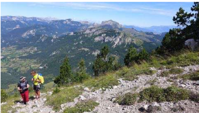
Montée à la Pare versant Diois