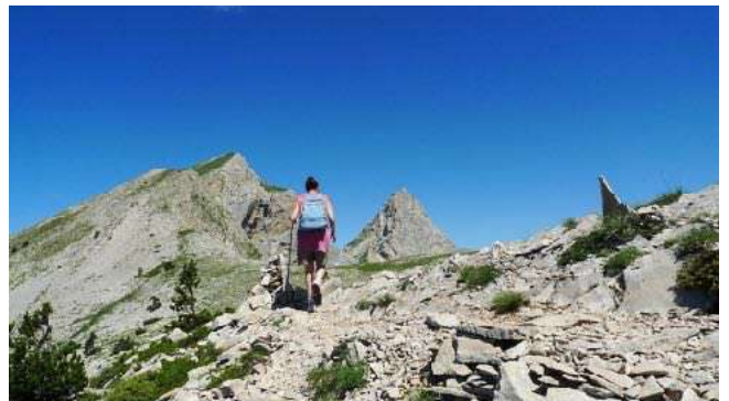
Vers le pas l'Agneau et la tête de Garnesier