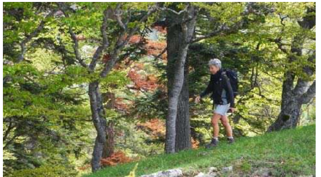
Belle randonnée forestière