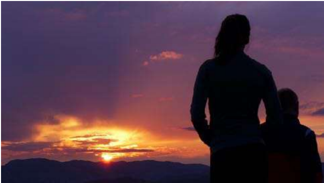
Rando de fin de journée