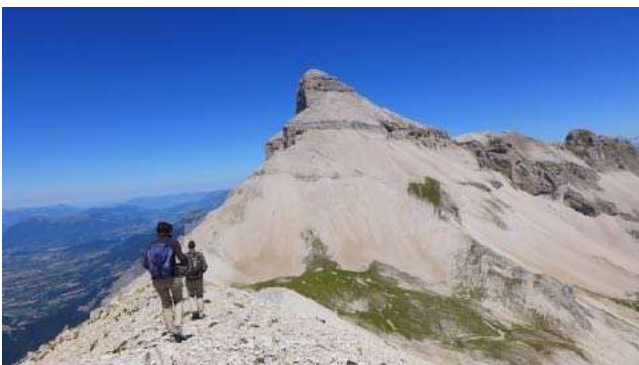
Au sommet de Vallon-Pierra en dévoluy