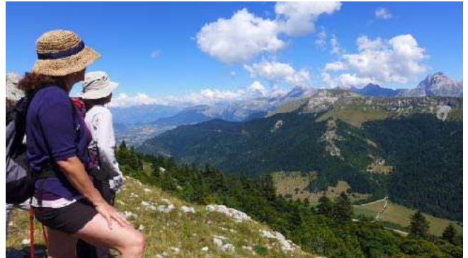
Panorama depuis les crêtes du Diois